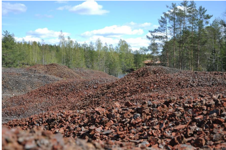
Slagghögar vid Västerån, foto från 2015.

gruvindustri. Det som mer än något utmärker byn är de vidsträckta slaggfälten, spår av Falu gruvnas hyttverksamhet. Inte ens Västeråns vindlingar är av naturen givna, hyttornas avfall i form av slagg har format vattendraget. Men det är att gå historien i förväg, låt oss ta det från början.