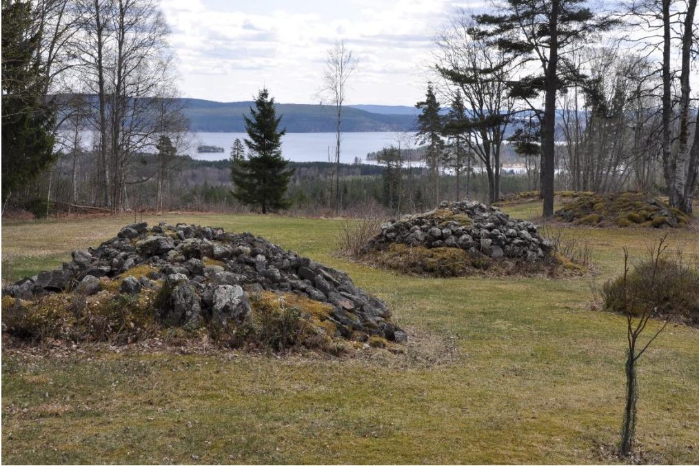
Odlingsrösen i Norlingberg, foto från 2015.