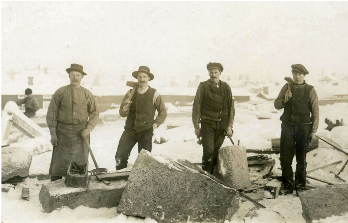
Stenarbeten vid Västra skolan 1914.