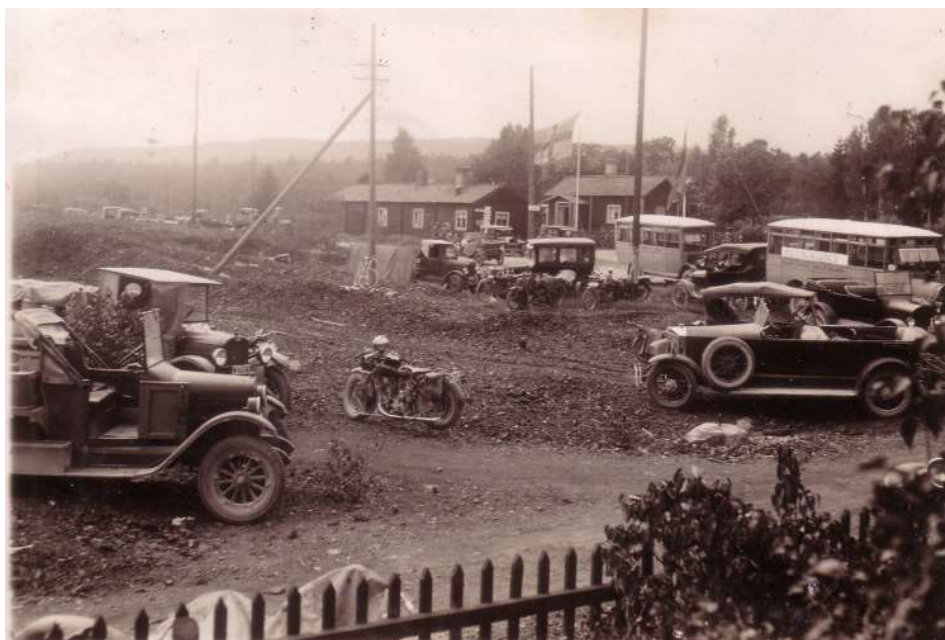
Parkeringen vid 1926-års backtävling

Norlingbergsbacken, undrar läsaren, den har man sannerligen aldrig hört talas om. Ja, så är det nog och ändock erbjuder denna trakt strax utanför Falun de mest underbara och storslagna naturscenerier. Man får leta upp de mest omtalade och besjungna sevärdheterna i Siljansbygderna, för att finna en motsvarighet till den tavla, som erbjudes betraktaren från Norlingbergsbackens krön. På söndagen kunna faluborna och alla de andra intresserade från olika håll i länet bli underkunniga om den saken och storligen skulle vi bedraga oss, om inte för från stunden Norlingberg bliver målet för många söndagsutflykter av naturälskaren.